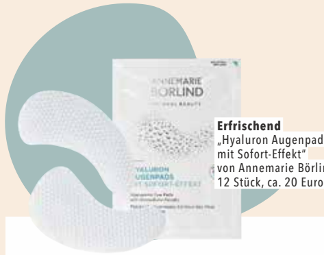
Erfrischend „Hyaluron Augenpads mit Sofort-Effekt“ von Annemarie Börlind, 12 Stück, ca. 20 Euro