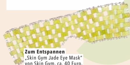
Zum Entspannen „Skin Gym Jade Eye Mask“ von Skin Gym, ca. 40 Euro, skingymco.com

Als ich die Jade-Maske zum ersten Mal aufgelegt habe, waren die Erfrischung und das Gewicht wie ein kleiner schöner Schock. Die Steine sind von Natur aus kalt, man kann sie für einen stärkeren Effekt vorher in den Kühlschrank legen . Das lässt selbst hartnäckige Schwellungen zurückgehen. Im heißem Wasser erwärmt, wirkt die Maske bei mir spannungslösend und soll faltenglättend sein. Davon merke ich allerdings weniger.