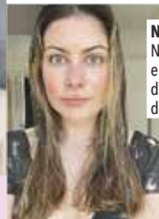
Nachher Nach ungefähr einer Woche ist das Ergebnis deutlich sichtbar