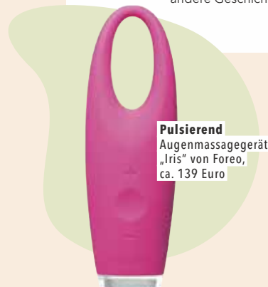
Pulsierend Augenmassagegerät „Iris“ von Foreo, ca. 139 Euro