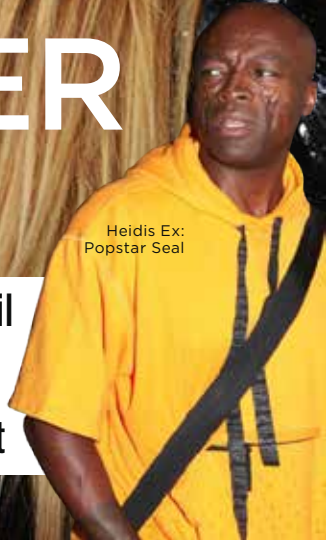
Heidis Ex: Popstar Seal

Es geht um ihre Kinder! Weil Ex-Mann Seal sich gegen ihren Umzug nach Deutschland stemmt, zieht Heidi Klum jetzt vor Gericht